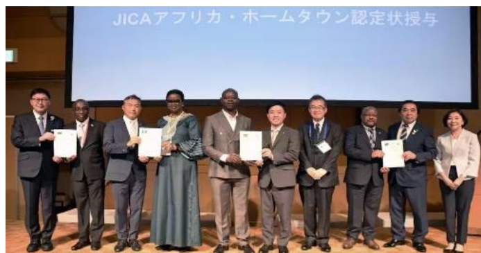
Gambar 3.1. JICA Networking Seminar for African Participants

Kasus Africa Hometown 2025 menunjukkan bagaimana misinformasi dapat memicu resistensi sosial terhadap pekerja asing di Jepang. Hasil analisis dokumen menunjukkan bahwa polemik ini berawal dari penyebaran informasi yang tidak sepenuhnya akurat mengenai program kerja sama yang sebenarnya hanya bersifat pelatihan vokasional jangka pendek. Namun, di ruang publik berkembang narasi bahwa pemerintah berencana menempatkan warga Afrika secara permanen di wilayah pedesaan Jepang. Penyebaran informasi tersebut memicu kekhawatiran masyarakat lokal terhadap perubahan komposisi sosial di wilayah mereka.